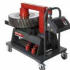
40 RMD cap. 600 kg