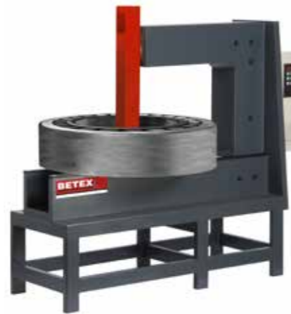
GIANT cap. 3500 kg