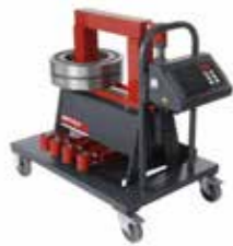
38 ZFD cap. 300 kg

BETEX® es una marca registrada de Bega Special Tools