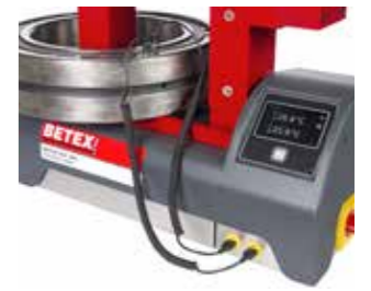
Detección dual de la temperatura (control de la variación de la temperatura)