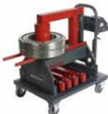
40 RSD cap. 350 kg