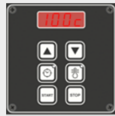
Vista delantera de Basic