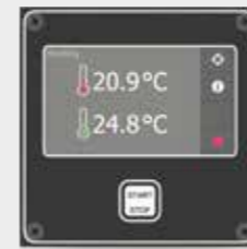
Vista delantera de Smart