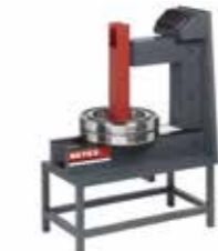
SUPER cap. 600 kg