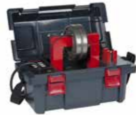
Calentador por inducción Betex portátil BETEX BLF 200